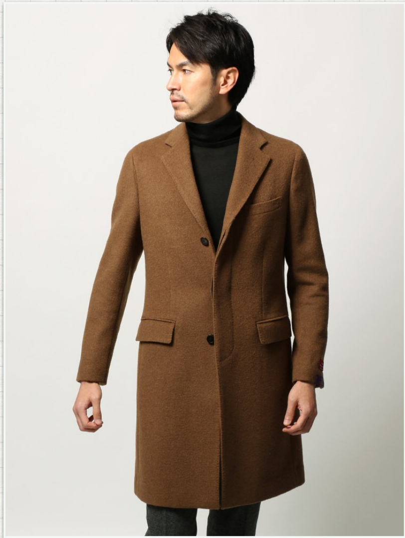
シングルチェスターコート