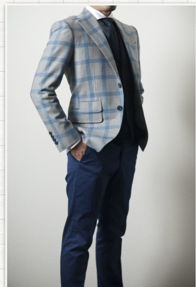
王道のファッション ジャケパンスタイル (ジャケット+パンツ)