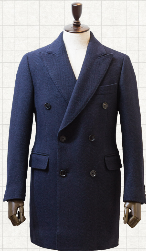
ダブルチェスターコート